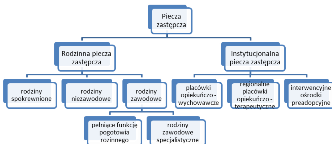
Rysunek 2. Formy rodzinnej oraz instytucjonalnej pieczy zastępczej